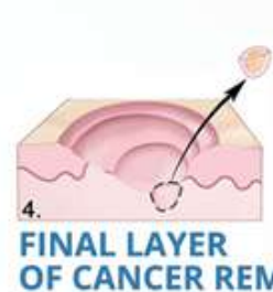
4. FINAL LAYER OF CANCER REMOVED