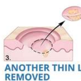
3. ANOTHER THIN LAYER REMOVED