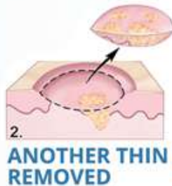
2. ANOTHER THIN LAYER REMOVED